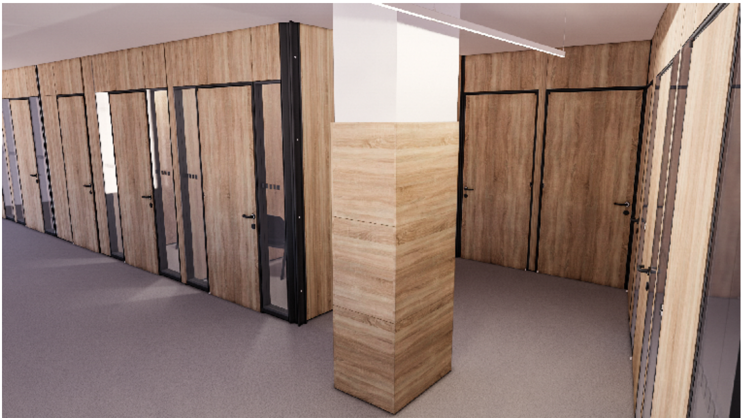
3NP - PŘEPÁŽKOVÁ PRACOVISTĚ, ŽIVNOSTENSKÝ ÚŘAD - POHLED Z HALY

VÝŠKOVÝ SYSTÉM Bpv, SOUŘADNICOVÝ JTSK ±0,000 = 251,28m N. M.