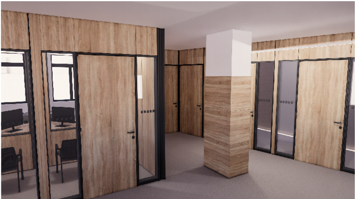
3NP - PŘEPÁŽKOVÁ PRACOVISTĚ, ŽIVNOSTENSKÝ ÚŘAD - POHLED Z HALY